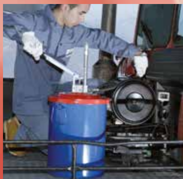
Appareil de graissage pour seau (uniquement 14-18 kg)

Nous proposons une gamme complète d'appareil de graissage ou de remplissage adaptés à tous les types de conteneurs couramment commercialisés, de 14 à 180 kg.