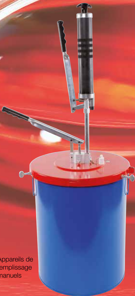
Appareils de remplissage manuels