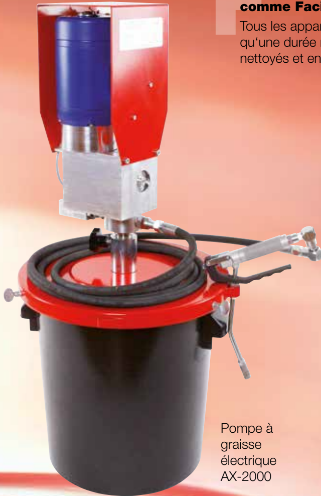
Pompe à graisse électrique AX-2000