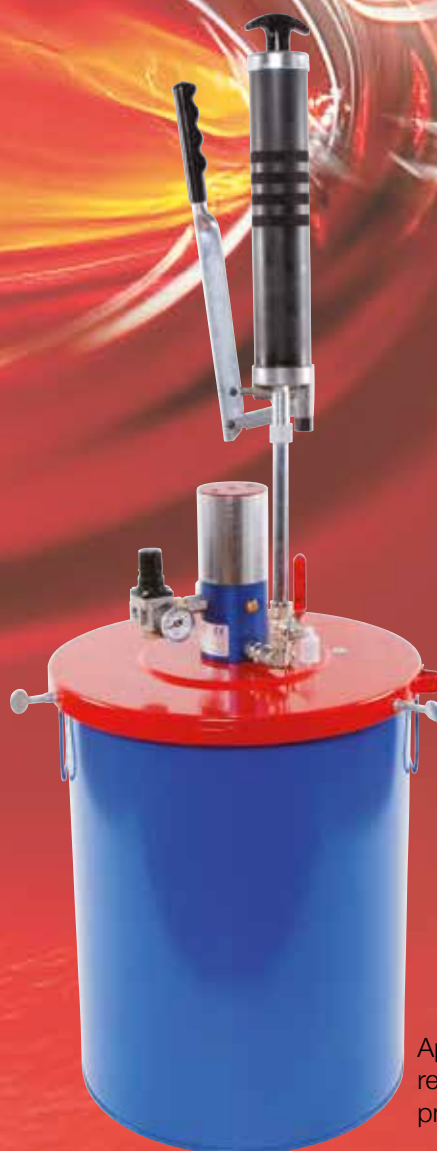
Appareils de remplissage pneumatiques