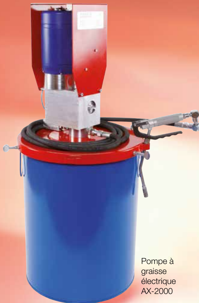
Pompe à graisse électrique AX-2000