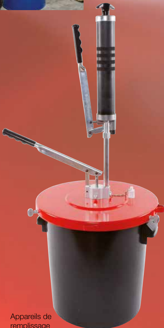
Appareils de remplissage manuels

Tous nos appareils sont fabriqués avec la plus grande précision selon l'expression „Qualité Suisse“.