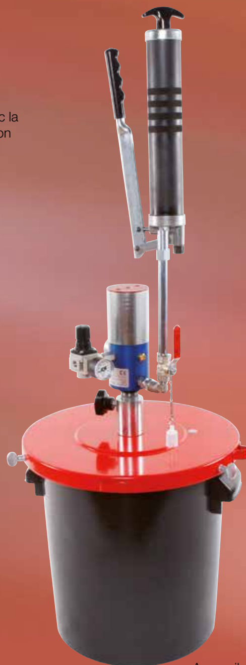
Appareils de remplissage pneumatiques