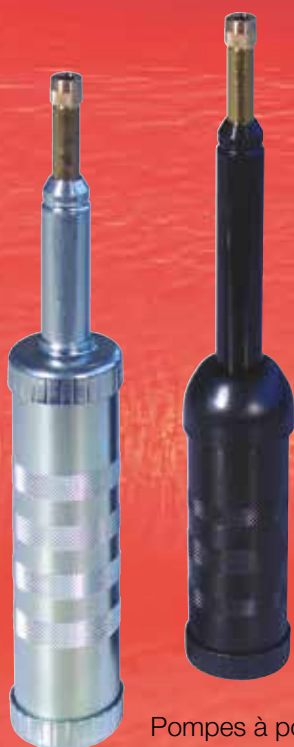
Pompes à pousser pour l'huile et la graisse

Le pistolet électrique propose un maximum de confort d'utilisation; il est particulièrement adapté pour être employé à de basses températures ainsi qu'avec des graisses visqueuses (jusqu'à NLGI 3), sans restrictions de fonctionnement.