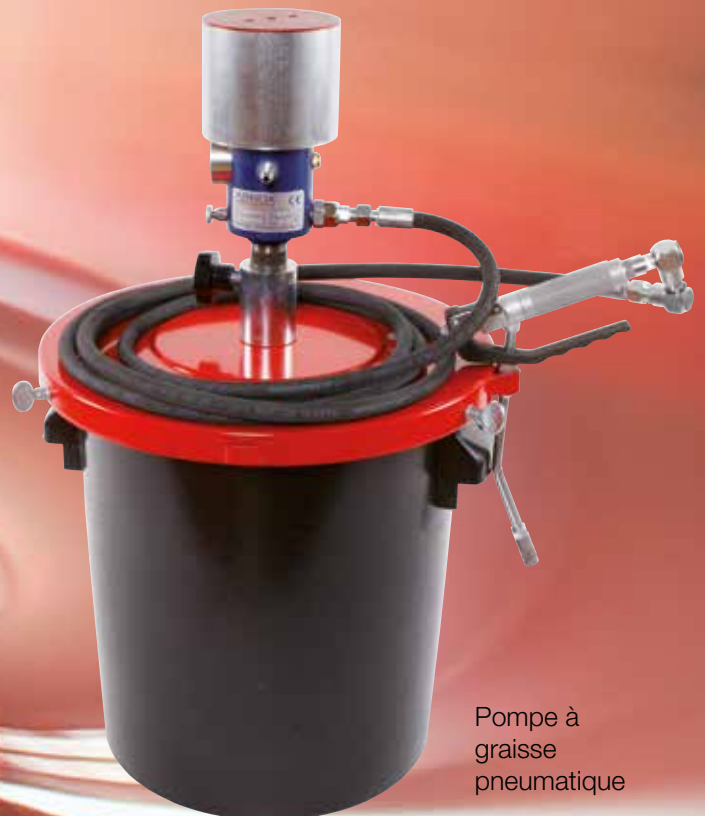
Pompe à graisse pneumatique

Les pompes à graisse électriques ou pneumatiques fonctionnent de manière silencieuse qui ne nécessite pas l'utilisation de protection auditive.