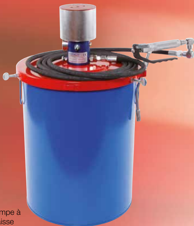
Pompe à graisse pneumatique

Le process ne sera garanti que si le transfert de lubrifiant est parfaitement assuré. C'est pour cela qu'Abnox propose un programme complet d'appareils de remplissage et de graissage ainsi que des pompes pour fût.