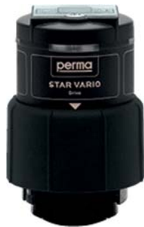
STAR VARIO Antrieb (Art. No. 107529)