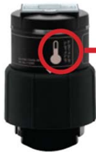
STAR VARIO Antrieb Tieftemperatur (Art. No. 113355)