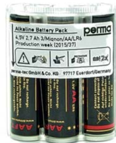
Batterieset STAR VARIO (Art. No. 101351)