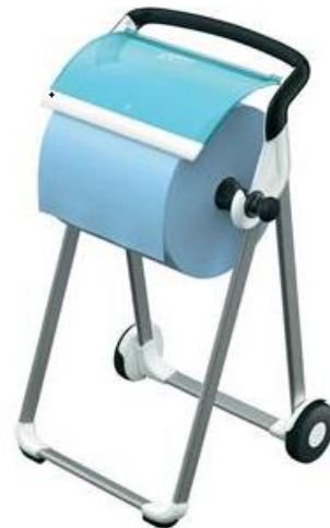
Bild: Bodenständer, fahrbar

Bodenständer fahrbar für Rollen, blau lackiert, mit Sackhalterung, fahrbar