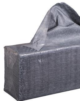
ICOSOFT® Sontara® Oil